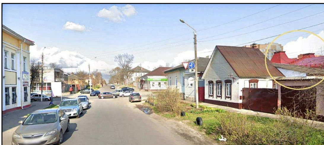
Вид с ул. Гагарина.