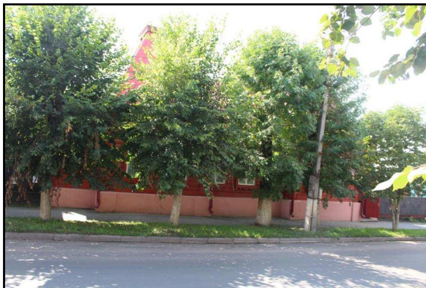
Точка оптимального восприятия ОКН