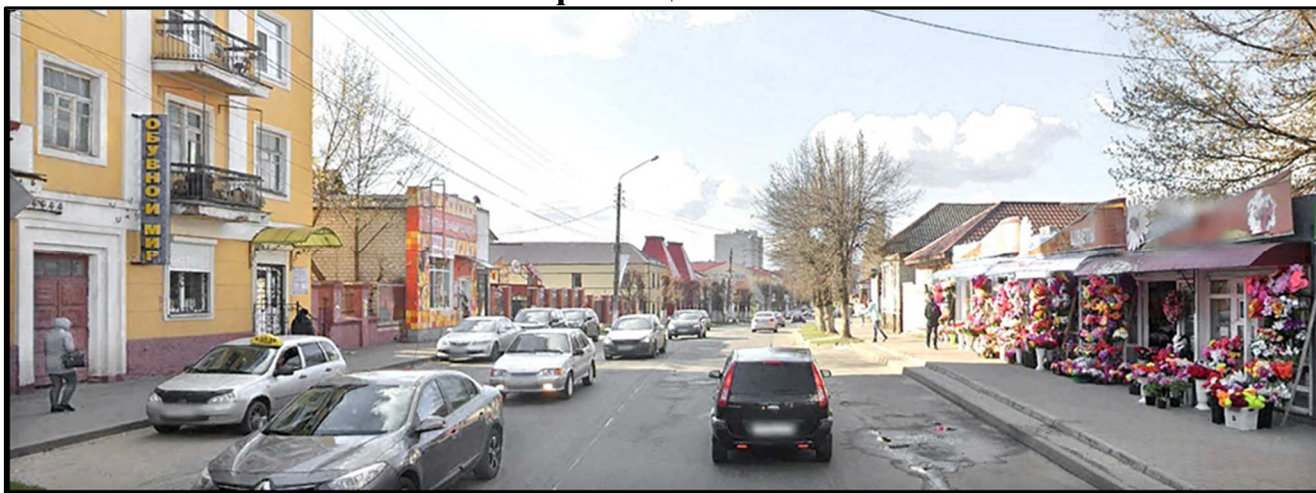
Вид с ул. Октябрьской